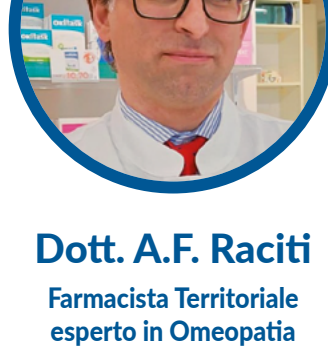
Dott. A.F. Raciti Farmacista Territoriale esperto in Omeopatia